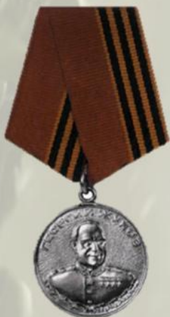
МЕДАЛЬ ОРДЕНА "ЗА ЗАСЛУГИ ПЕРЕД ОТЕЧЕСТВОМ" I И 2 СТЕПЕНИ