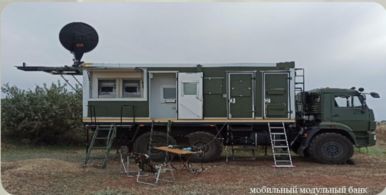
мобильный модульный банк